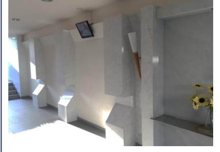
コメント: 防犯カメラモニターあり