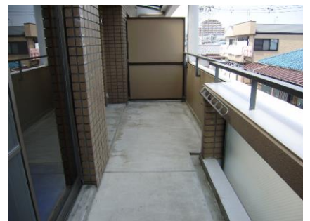
ワイドスパンバルコニー