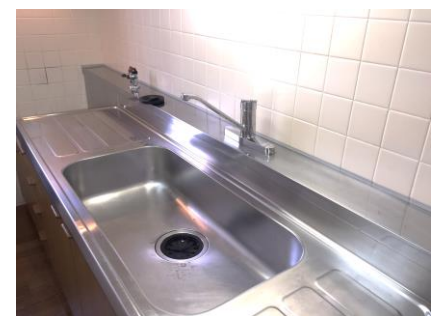
コメント: 独立型のキッチン