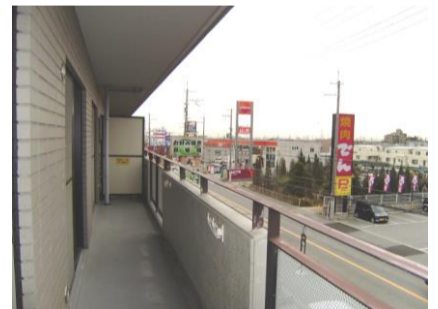
コメント: ワイドバルコニー(Aタイプ)