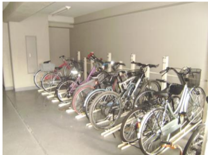
コメント: 屋内駐輪場