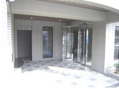
コメント: エントランス内坪庭