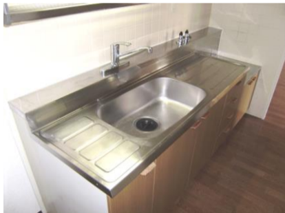
コメント: シングルレバー水栓標準装備(写真はAタイプの独立キッチン)