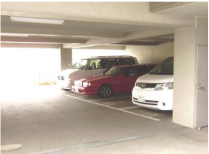
コメント: 一部屋根付駐車場