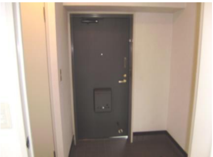
コメント: スペースを有効利用した間取りです