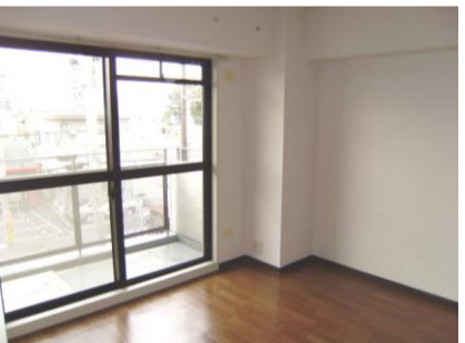
コメント: Aタイプは全室採光です