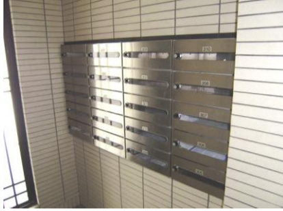
コメント: 外入れ内出しの郵便受け