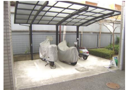
バイク置き場(有料)