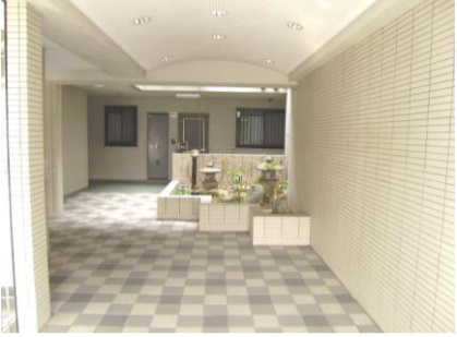
コメント: 吹き抜けにより開放感のある廊下