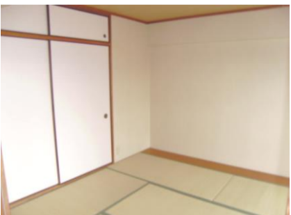
コメント: 押入天袋付き。タンスを置きやすい、板の間付