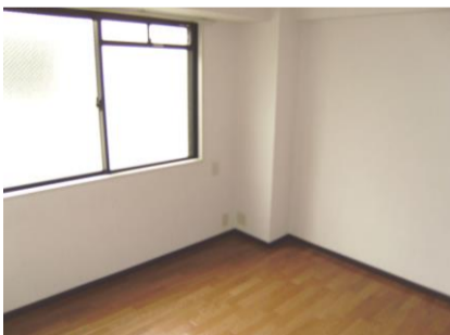
コメント: 明るい洋室です