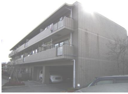
コメント: タイル貼りの外観