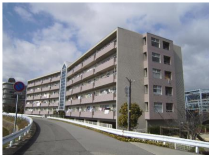
コメント: 全戸南向き