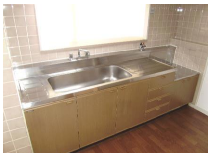
コメント: リビングが見渡せるカウンターキッチン