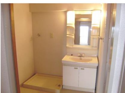
コメント: 清潔な水回り