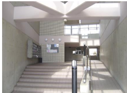
コメント: 南側から2階へ通じるエントランス