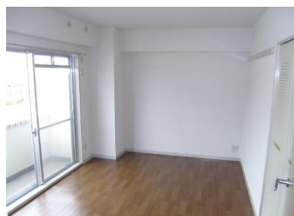
コメント: 洋室は全室クローゼット有り