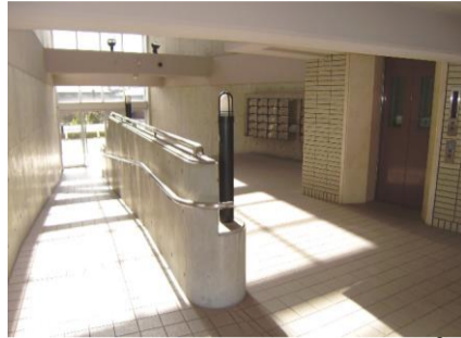
コメント: エントランス内 スロープ