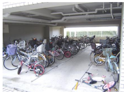
コメント: 広い自転車置場