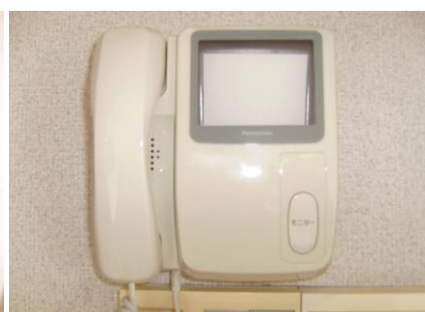
モニター付インターホン