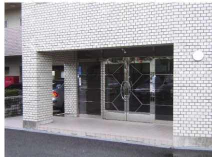
コメント: 北側 エントランス有り