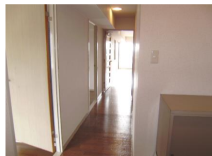
コメント: シューズボックスを設置しました