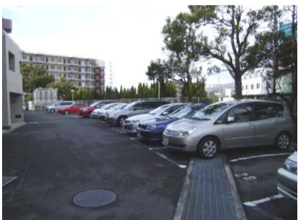
コメント: 全戸数分駐車場確保