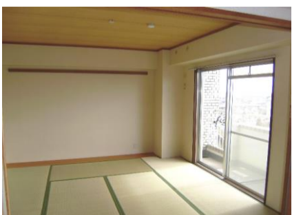
コメント: 4LDKは8帖の和室