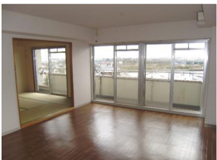
コメント: 12帖以上の広々リビング